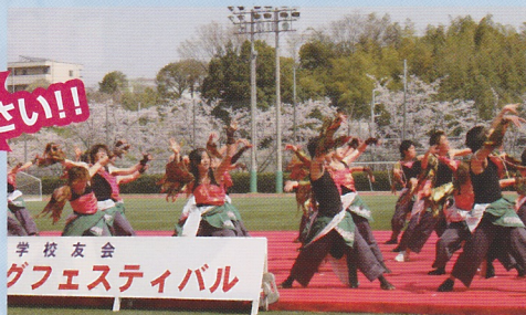
校友会 グフェスティバル