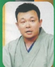
笑福亭風喬 (福岡出身)