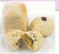
おいもめくもりパン

関西大学の「理系の研究力」と「文系の 構想力」、そして「企業の実行力」、こ れら3つの“力”が1つになった時、今ま でのパンには出せなかった“喉越しスッ キリ、食べやすいパン”を生み出した。 “おいも めくもりパン”(白ハト食品工業(株)製品) これの誕生秘話とともに、皆様にご紹介いたします。